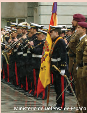
Ministerio de Defensa de España

Sapromil tiene mayor incidencia sobre el personal de la Armada